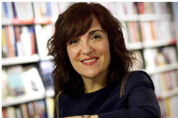
Elvira Lindo (1962) EN “¿QUIÉN HA DE HACER LOS DEBERES?”, El País, 17 XII-16

Todos deberíamos entender que un niño no se educa solamente en el colegio y que los resultados académicos son reflejo de lo que está ocurriendo en un país: el nivel de educación en la calle, en los medios. La ansiedad que provoca, la agresividad, la falta de expectativas, los malos modos, las palabras gruesas. Eso importa. Cargar contra el profesorado el deber de que los niños sean excelentes es injusto. Los cachorros se educan en manada, así que usted y yo, como parte de ella, también tenemos un montón de deberes que hacer.