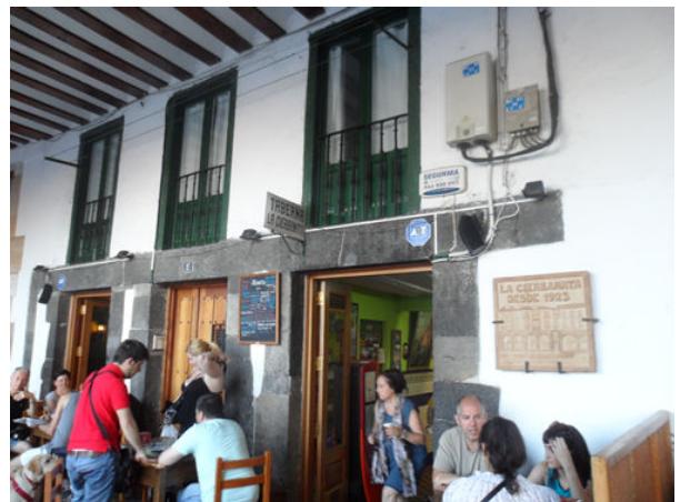
Biblioteca municipal y taberna la Cierbanata de Castro Urdiales, Cantabria