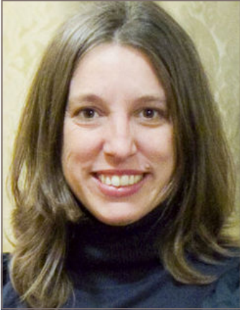
Victoria Camps (Barcelona, 1932)

Seguimos siendo individualistas, pero la crisis nos ha servido para ver que tenemos que ser más solidarios, que nos tenemos que unir, que cuestionar más, ser más radical y perder el miedo que inmoviliza.